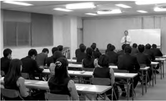
京都信用金庫乙訓一円の支店の皆さまのご協力により多くの行員の皆様にご参加いただきました

銀行業と税理士業はともにお客様の資産・借入や経営状況を良く知る立場にあり、両者の業務も重なる部分が多くあります。