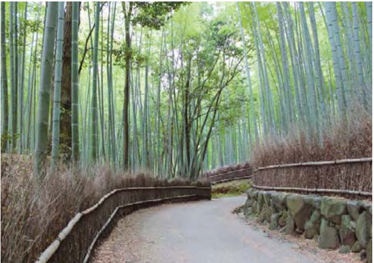
京都嵐山 竹林の小径