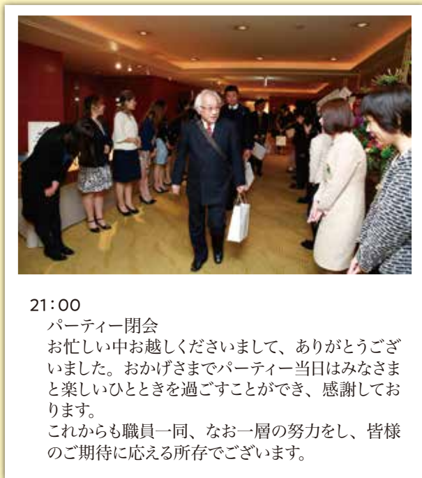
21:00 パーティー閉会 お忙しい中お越しくささいまして、ありがとうございます。おかげさまでパーティー当日はみなさまと楽しいひとときを過ごすことができ、感謝しております。 これからも職員一同、なお一層の努力をし、皆様のご期待に応える所存でございます。