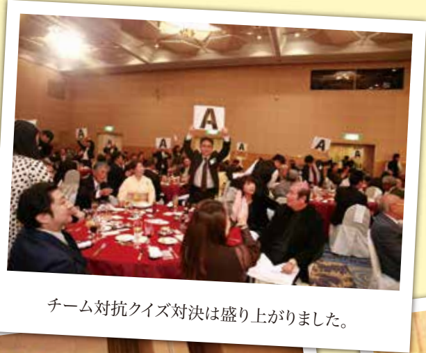
チーム対抗クイズ対決は盛り上がりました。