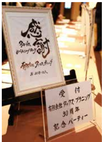
筆文字ポエトリー様に 素敵なウエルカムボードを 作成して頂きました。

有限会社タックス・プランニングは、設立30周年を迎えることができました。 これもひとえに皆様方のお力添えとご愛顧の賜物であると深く感謝しております。 日頃からの感謝の気持ちを含めまして、去る11月22日に ウェスティン都ホテル京都にて記念パーティーを開催させていただきました。 ご多忙のところを、約260名という多くのご参加をいただき、 改めて当社が皆様に支えて頂いていることを実感いたしました。