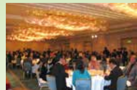
2013年 25周年記念パーティーの様子