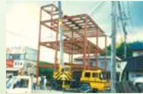
1989年 事務所新築工事の様子