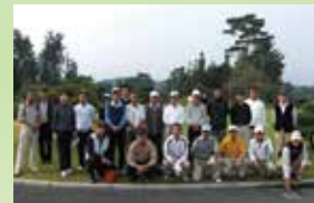
2008年 ゴルフコンパにて