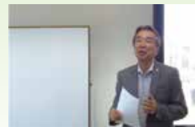
2017年 相続セミナー開催