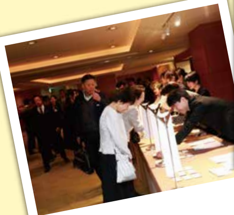
18:00 受付開始です 皆さん続々とおいでになられます。