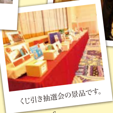
くじ引き抽選会の景品です。