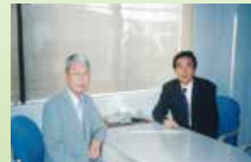
2003年 谷税理士法人 事務所にて