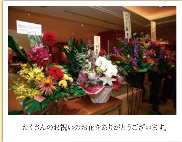
たくさんのお祝いのお花をありがとうございます。