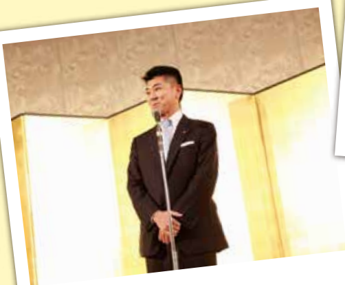
18:40 衆議院議員 泉ケンタ様より 祝辞を頂戴いたしました。