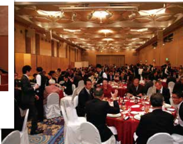
パーティーには多くの方にお越し頂きました。 誠にありがとうございます。